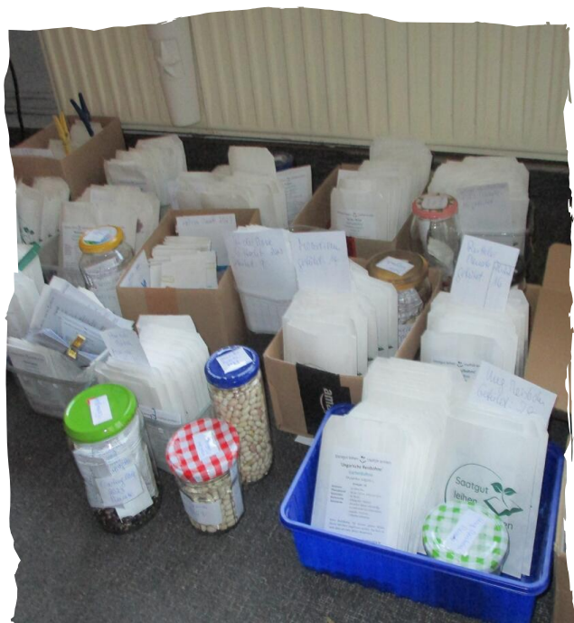
Saatgut für den Versand vorbereitet, Renate Düring, VEN

Auch die Bibliotheken bereiten sich vor. An vielen Orten werden begleitende Veranstaltungen geplant und die Rückgaben für den erneuten Verleih werden aufbereitet.